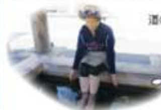
道の駅・十津川郷の足湯

昼食に名物の「めはりずし」をいただきました。店のおじさんに「めはりずし」のいわれを聞きました所、蕎麦の漬物の葉で包んだ、大きなおむすびのこと、これがあまりに大きいから目を見張ったとか、目を見張るほど美味しいから名づけられたそうです。増加感がちょうど美味しかったです。