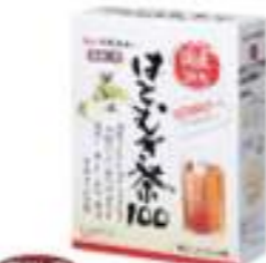
国産活性はとむぎ茶 100 120g (4g×30袋)

ハトムギ茶はノンカフェインでノンカロリー！だから小さなお子様でも安心♪ノンカフェインなので就寝前のお飲み物としてもオススメです。