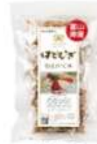
小袋タイプ 国産はとむぎほうじ粒 140g (7g×20袋)

ハトムギ茶はノンカフェインでノンカロリー！だから小さなお子様でも安心♪ノンカフェインなので就寝前のお飲み物としてもオススメです。