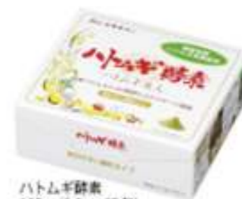
ハトムギ酵素 150g (2.5g×60包)

腸内環境を整えてくれるヨーグルトに、「ハトムギ酵素」を混ぜたデザートです。2つのコラボで、体の内からきれいに!トッピングを日替わりでお楽しみください。