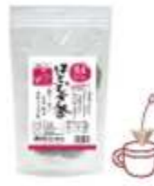
国産活性はとむぎ茶 ティーバックタイプ 75g (2.5g×30袋)