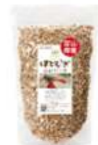
国産はとむぎほうじ粒 250g

「国産はとむぎほうじ粒」はハトムギの形状をそのまま残してポリポリと食べられます。お子様のおやつに、お惣菜にトッピング、シリアルにしてお食べいただけます。