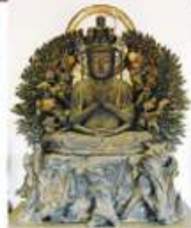
千手観音菩薩坐像(室町時代)

奈良県北葛城郡王寺町にある達磨寺(だるまじ)に行きました。山号は片岡山、正式名は片岡山達磨寺です。達磨といえば置物や玩具で知られていますが、その形は達磨大使の座禅のお姿がもとになっているそうです。知りませんでした。達磨寺は聖徳太子との深い縁があり、その伝説は日本書紀にも載っているようです。