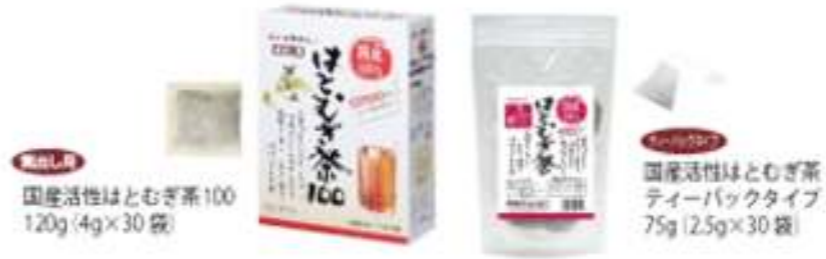
国産活性はとむぎ茶100 120g(4g×30袋)