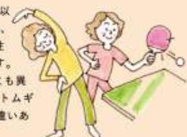
茨城県 女性 76歳

「ハトムギ酵素」を少なくとも30年以上は飲んでます。現在、健康体操、混声合唱団、卓球(女性のみ)、(男性との混合)と週4回活動しています。毎年受けている成人病検診は、どこも異常がなし。すこぶる健康です。「ハトムギ酵素」が支えてくれているのは間違いありません！