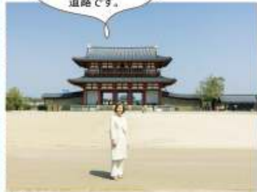
朱雀門 朱雀門の中央奥に大極殿が見えます。