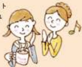
北海道 女性 47歳

「国産活性はとむぎ茶100」を約1年前から飲ませています。学校にも水筒に入れて持たせています。まだまだ肌が良くなったとは言えませんが、これからも続けたいと思っています。肌が弱い人用のハトムギせっけんやハトムギ保湿クリームなどがあればいいと思います。