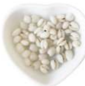
精白はとむぎを炊いたもの

原産地は東南アジアやインドが有力です。渡来時期は、奈良時代、安土桃山時代、江戸時代など諸説がありますが、日本で栽培をされたのは昭和56年です。(米の転作物として国の奨励で始まりました。)日本の栽培の歴史はまだ短く、安心・安全を求める消費者のニーズに供給が追いついていません。今後、国内の栽培収量を拡大することが望まれます。