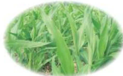
有機栽培のはとむぎ若葉

昔から青汁は体に良いとされていましたが、マズイというイメージが強くありました。そこで弊社は、飲みやすい青汁の開発に取り組み、日本で初めてハトムギを有機栽培し、「はとむぎ若葉」を原料にした青汁の開発に取り組みました。安心・安全な原料であることと、さまざまな機能性など、大学と共同研究を行い商品化しました。「あっちゃんの青汁」は有機ハトムギ若葉100%の無添加の商品です。