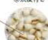
④精白はとむぎ(ヨクイニン)

殻つきハトムギはお茶の原料にします。食べるハトムギは、①殻を取り去る②薄皮を取る③洗皮を取る④精白ハトムギ(ヨクイニン)ができます。④に至るまでに歩留りは約50%になります。