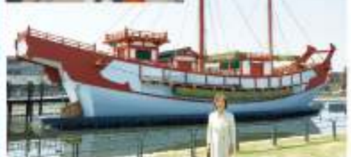
復原遣唐使船 磁石も海回らない時代に星や太陽を見て航海したのです。船の大きさは全長30m、幅7~10m、マスト高15m、約150人が乗り、食料は米を干したもののや水、その他乾物などだそうです。

帆は絹代(あみしろ)という、アシやシロを薄く削ったものを平らに編んだものです。布ではないのです。