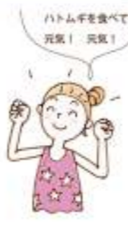
ハトムギを食べて元気! 元気!

ハトムギ、緑豆、トウモロコシ、メロン、冬瓜、アユ、海藻、ブドウ、レタスなどは水分代謝を高めてくれます。