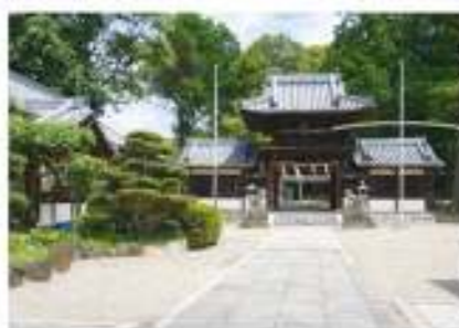
楼門 手入れの行き届いたお庭の正面に、立派な楼門が建っています。楼門には源田 実という方の「航空祖神」という書が掲げてあり、中央に木製のプロペラが飾ってあります。