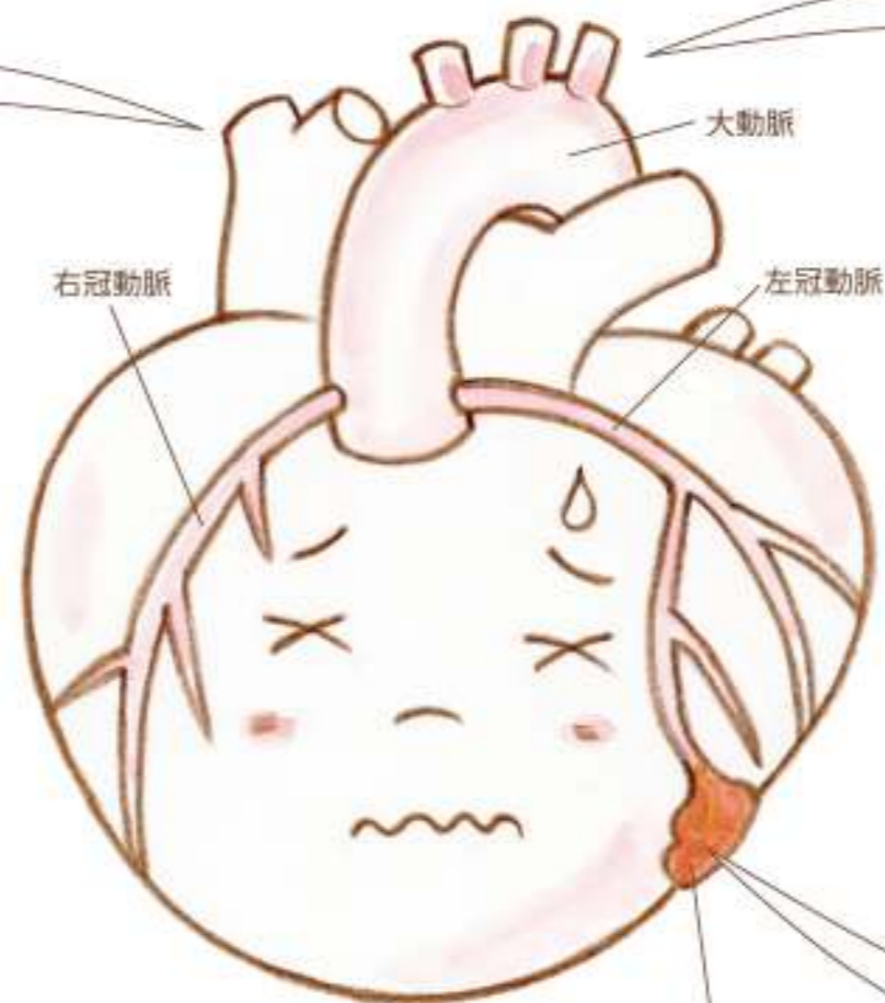
(イラストは心臓のイメージです)

高温多湿の夏は、発汗によって体内の水分が大量に失われます。すると血液濃度が高くなり、ドロドロの血液では血管内に血栓ができやすくなります。中医学では「血汗同源」という言葉があり、大量の汗をかくと血の不足にもつながると考えます。汗をかく暑い夏はサラサラ血液を保つため水分を十分に摂り、全身に血液を送っている心臓に負担をかけないよういたわりましょう。心臓病の危険因子は高血圧、脂質異常症、糖尿病などがあります。これらの症状があるほどリスクが高くなります。