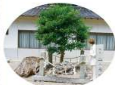
二之矢塚の石碑 御祭神の櫛玉鏡速日命(物部氏の祖神)が天磐船(あめのいわふね)に乗って天から放った二本の矢が落ちたところだそうです。

プロペラは旧日本陸軍九一式戦闘機 第二次世界大戦前の日本陸軍最初の単葉の戦闘機のもので、昭和18年8月に奉納されたそうです。