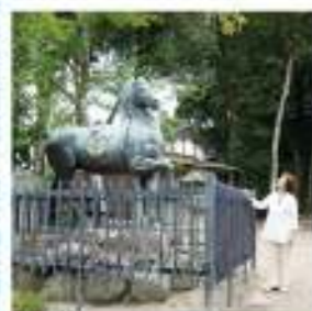
神馬像 「矢尻付き違ひ矢」の神紋を付けた立派な像です。